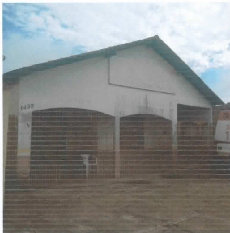
Figura 01: Vista geral da Edificação – Fachada principal.