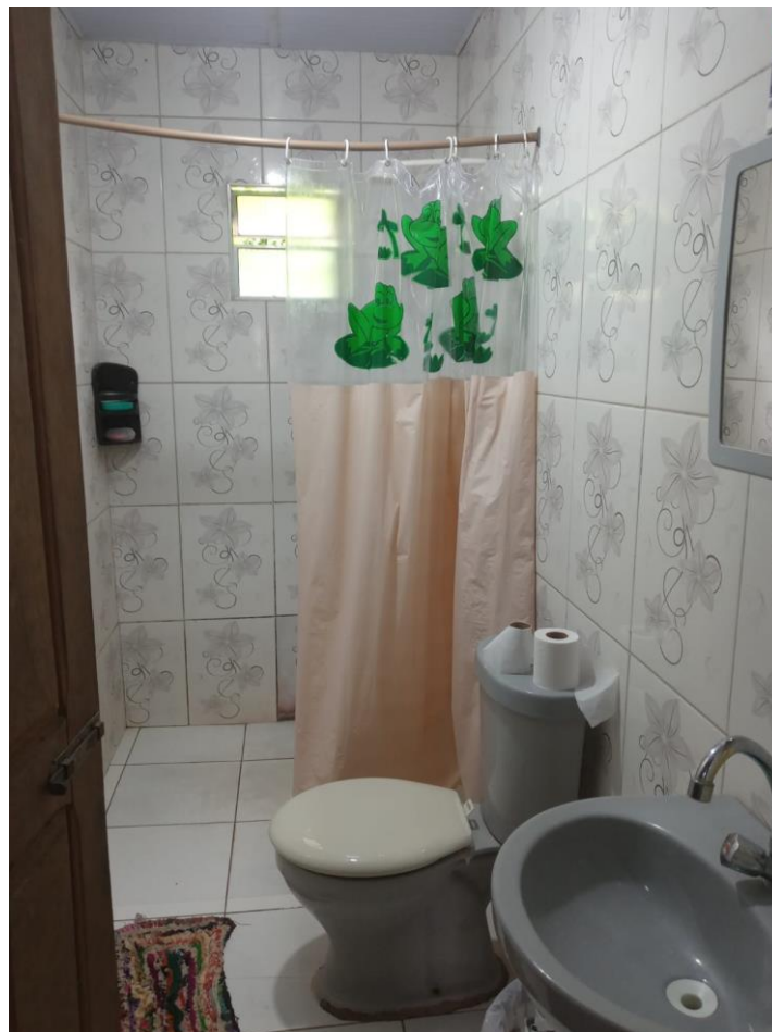
Figura 6: Sala funcional da edificação vistoriada. 04/01/2022