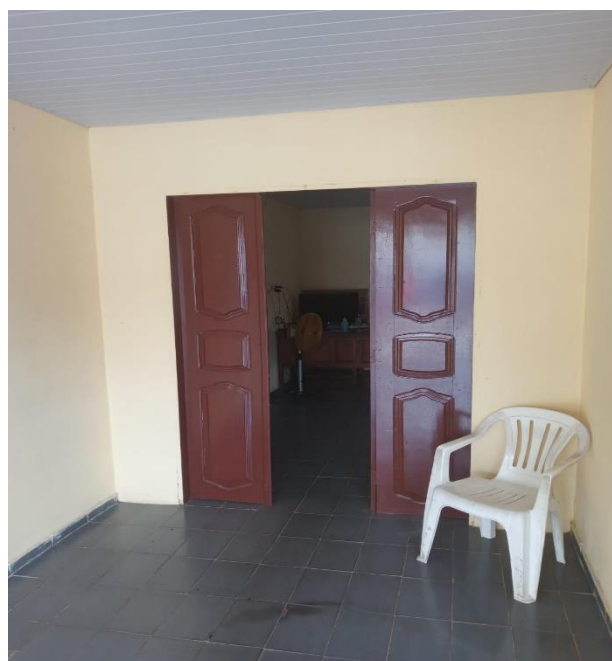
Figura 4: Hall de entrada da edificação vistoriada. 04/01/2022.

Toda a edificação é em alvenaria rebocada e com pintura nova. A cobertura não apresenta, até o momento de vistoria, sinal de vazamentos onde possa ocorrer fluxo de água pluvial. O forro em PVC aliada aos pontos de luz e as inúmeras janelas laterais (arejadas) capacita uma luminosidade adequada. A cobertura principal é feita com telha de argila tipo PLAN com caimento adequado.