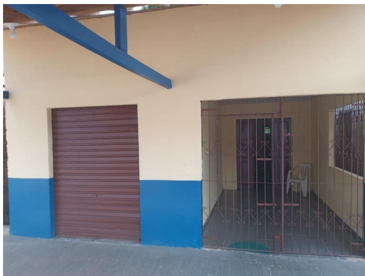
Figura 3: Entrada da edificação vistoriada. 04/01/2022.

Toda a edificação é em alvenaria rebocada e com pintura nova. A cobertura não apresenta, até o momento de vistoria, sinal de vazamentos onde possa ocorrer fluxo de água pluvial. O forro em PVC aliada aos pontos de luz e as inúmeras janelas laterais (arejadas) capacita uma luminosidade adequada. A cobertura principal é feita com telha de argila tipo PLAN com caimento adequado.