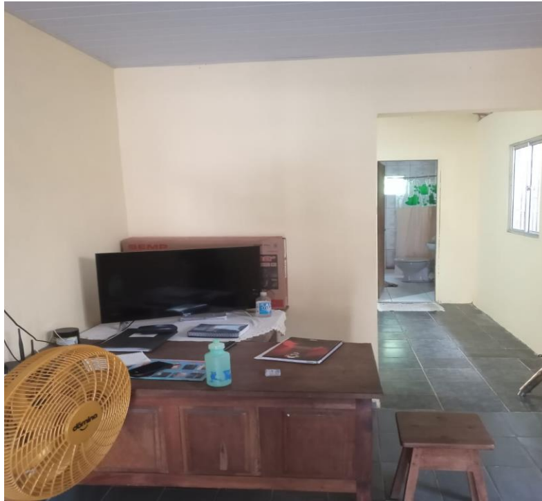
Figura 5: Sala funcional da edificação vistoriada. Fonte: Arquivo Pessoal 004/01/2022