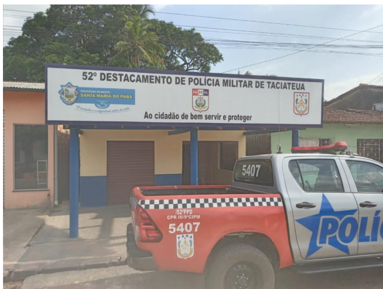
Figura 2: Foto da fachada. Data: 04/01/2022.