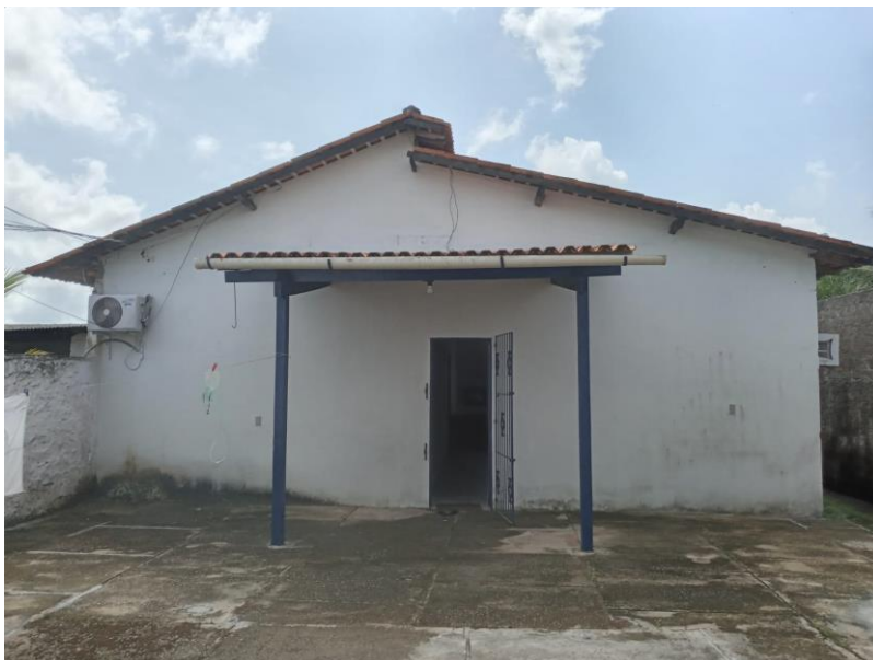
Figura 3: Entrada do almoxarifado e dormitório da edificação vistoriada. 14/01/2022.

Toda a edificação é em alvenaria rebocada e com pintura nova. A cobertura não apresenta, até o momento de vistoria, sinal de vazamentos onde possa ocorrer fluxo de água pluvial. O forro em lambril aliada aos pontos de luz. A cobertura principal é feita com telha de argila tipo PLAN com caimento adequado.