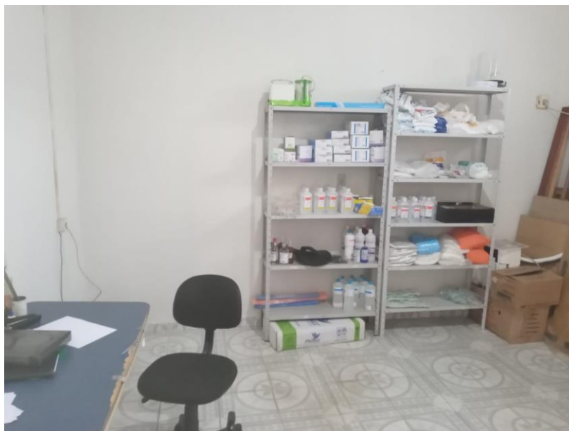
Figura 4: Almoxarifado vistoriada. 14/01/2022.

Toda a edificação é em alvenaria rebocada e com pintura nova. A cobertura não apresenta, até o momento de vistoria, sinal de vazamentos onde possa ocorrer fluxo de água pluvial. O forro em lambril aliada aos pontos de luz. A cobertura principal é feita com telha de argila tipo PLAN com caimento adequado.