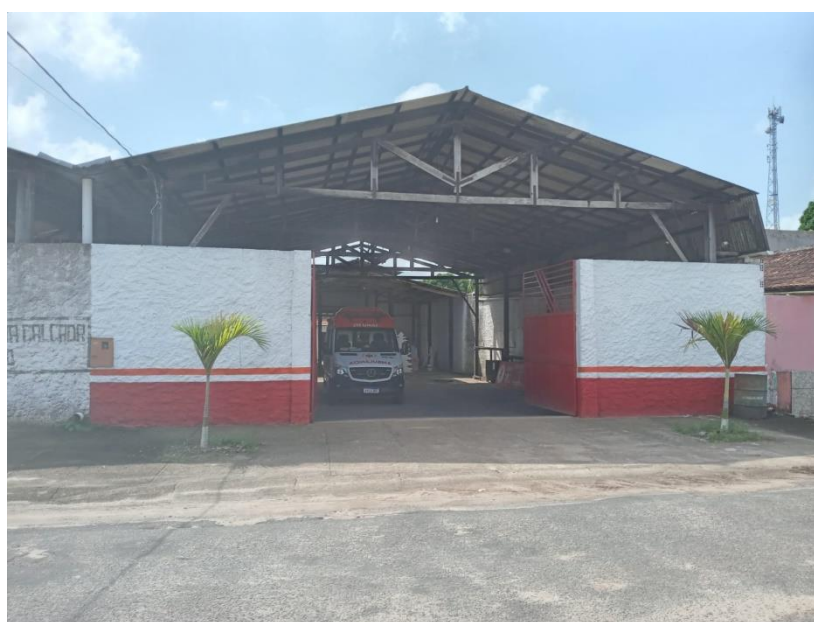
Figura 2: Foto da fachada. Data: 14/01/2022.