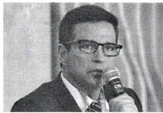
Roberto Campos Neto não confirmou declaração de Bolsonaro

Ele afirmou também que a economia está caminhando para um processo de tokenização (em referência aos tokens, criptomoedas com lastro em ativos reais) em escala global, e que está nos planos da autoridade monetária iniciar mais à frente uma integração das novas frentes de tecnologia lançadas nos últimos anos, como o Pix e o Open Finance. "Estamos entrando em uma fase de tecnologia muito inte-